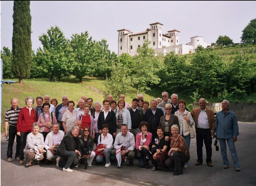
Foto di gruppo ripresa dall'azienda vinicola Vinska klet "Goriska Brda" – sullo sfondo il castello di Dòbrovo

Programma ore 7,30 ritrovo dei partecipanti presso il parcheggio delle scuole medie, via De Pellegrini ore 7,35 partenza da Porcia in corriera ore 8.45 arrivo a Rosazzo, visita guidata della Basilica, del chiostro e del Sentiero delle Rose ore 13,00 pranzo all'interno del castello di Dòbrovo ore 15,00 Visita guidata del Castello e della mostra del pittore di fama mondiale Zoran Music ore 16,00 visita guidata alla Vinska klet "Goriska Brda", la più grande cantina della Slovenia Percorso panoramico in zona collinare ore 17,00 Visita guidata del paese medioevale di Smrtno (San Martino) ore 18.00 Degustazione guidata di vini con spuntino ore 19.00 Partenza ore 20.00 Rientro a Porcia